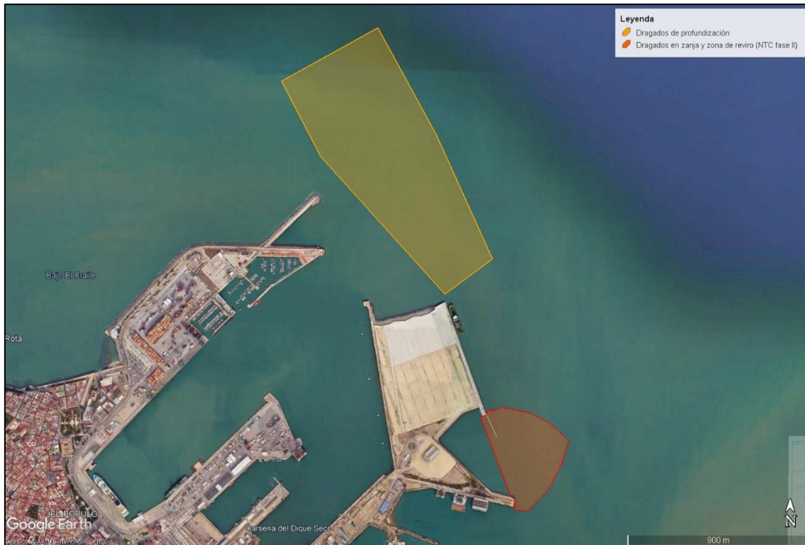
Ilustración 1. Zonas de dragado.

En la siguiente ilustración se muestran las diferentes zonas de dragado: