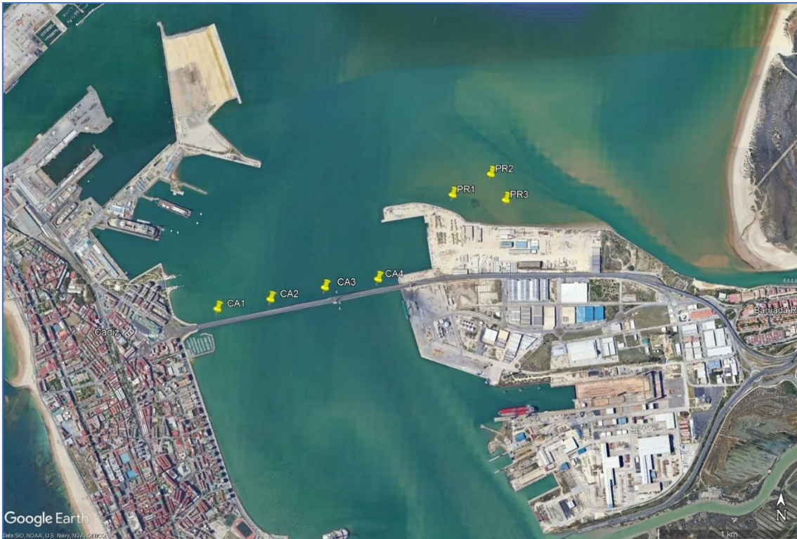
Ilustración 1. Estaciones de control de turbidez hacia el saco interno de la bahía y en torno a la pradera de fanerógama

La distancia desde la pluma a la que habrá que extender los controles será aquella en la que se vea que no existe influencia del dragado. Esto se producirá midiendo cada día de campaña en estaciones blanco y estaciones de control localizadas cercanas a los elementos sensibles. Las estaciones blanco o de referencia estarán localizadas en sentido contrario a la corriente. Las de control en la entrada al saco interno de la bahía y alrededor de los haces de fanerógamas del Bajo La Cabezuela. Una posible propuesta de estaciones fijas de control sería la siguiente: