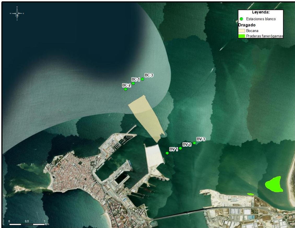
Ilustración 4. Estaciones blanco en vaciante y llenante para el dragado en la bocana