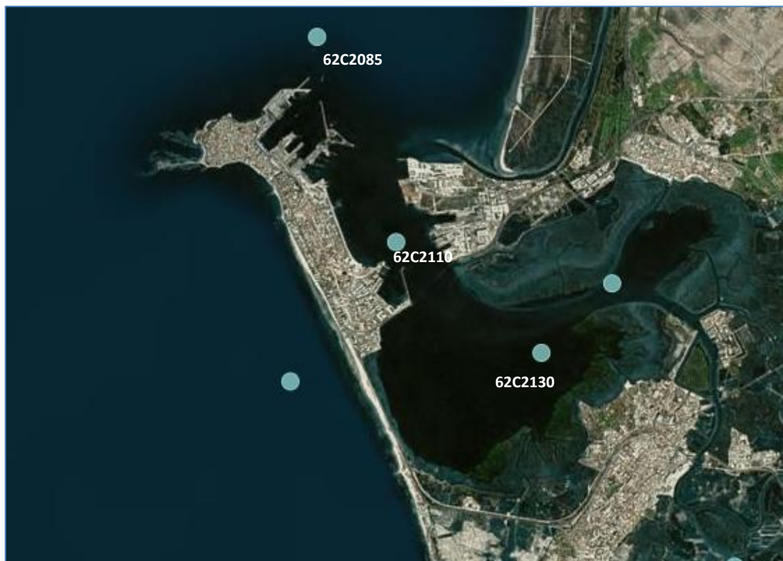
Ilustración 5. Localización de las estaciones de la Red de Control de Calidad de las Aguas de las Demarcaciones Hidrológicas Intracomunitarias en el entorno de la zona de estudio

No obstante, en la zona de estudio se localizan las siguientes estaciones de la Red de Calidad de Aguas de la Junta de Andalucía (las que refiere el IEO de la Tabla 16 del EIA):