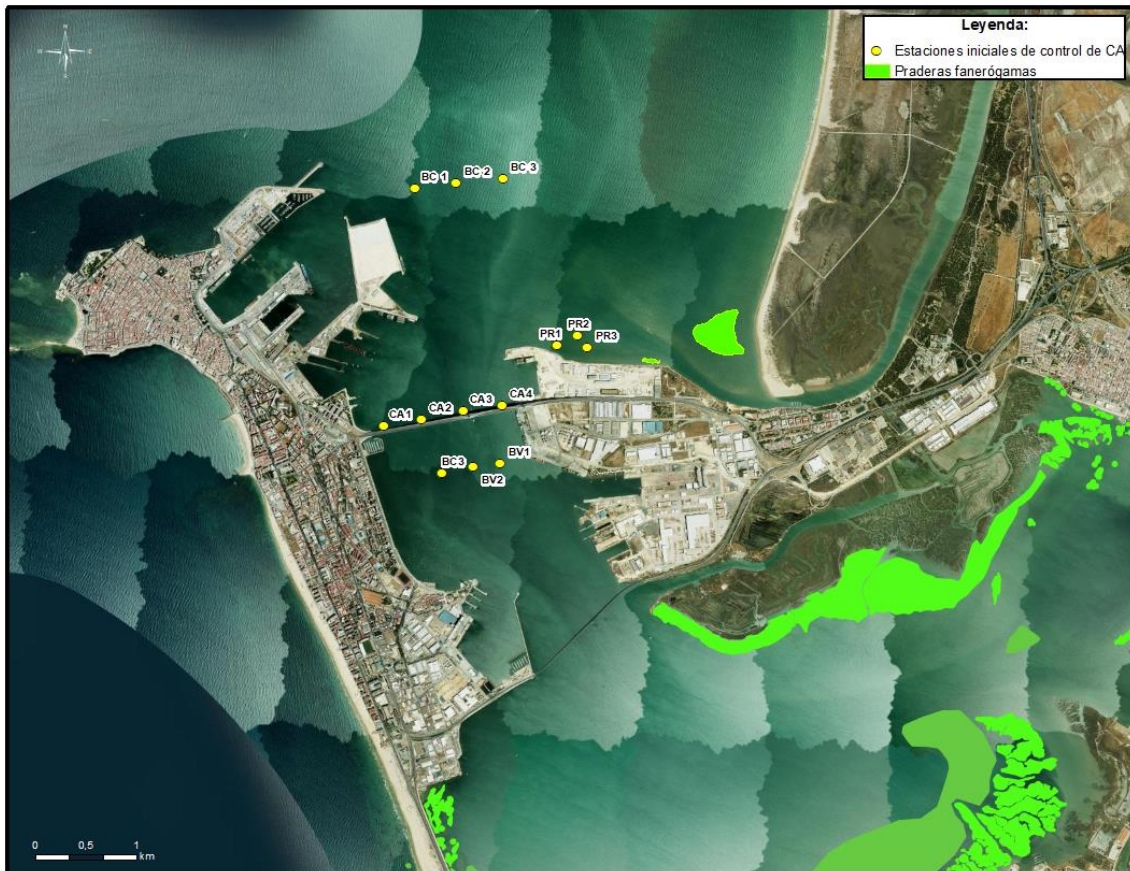
Ilustración 2. Localización de las praderas de fanerógamas y estación inicial de control de calidad del agua.

Antes esta situación, la Dirección Ambiental propuso a la Dirección de Obra una modificación de las estaciones de control y blanco de forma que éstas quedasen más cercanas a las praderas y poder así detectar cualquier afección debida a la turbidez del dragado. Tras consenso se estableció la siguiente red de muestreo en la que se han estado ejecutando los controles hasta la fecha: