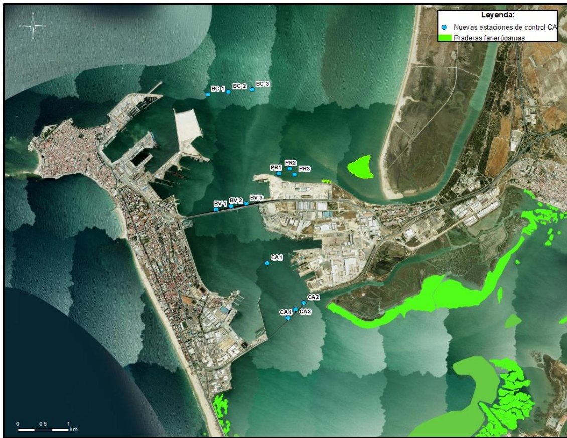
Ilustración 3. Nueva red propuesta para el control de calidad del agua

Esta red de estaciones aplica cuando se está produciendo el dragado en zanja y zona de reviro o dragado general. El 18/09 dio comienzo el dragado de la bocana, bajo la cobertura de la DIA de profundización de 2023. El equipo técnico constató en campo que los blancos anteriores quedaban alejados de la zona de trabajos. Por este motivo se establece una nueva localización para las estaciones blanco, tanto en vaciante, BV1, BV2 y BV3, como en llenante, BC1, BC2 y BC3 que aplicarán cuando se esté dragando en la bocana. Para las otras zonas se utilizará la red inicial. La localización de los nuevos blancos propuestos es la siguiente: