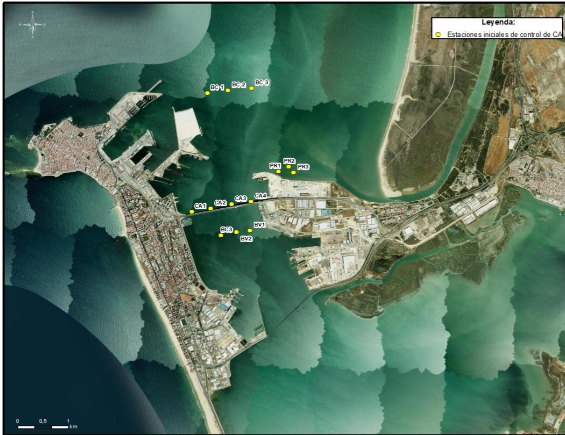
Ilustración 1. Red inicial de estaciones para el control de la calidad del agua.

Sin embargo, en la primera campaña efectuada se observó que las fanerógamas del saco interno de la Bahía de Cádiz quedaban muy alejadas de los blancos en vaciante y las estaciones de control CA1, CA2, CA3 y CA4. El equipo de campo notificó esta situación y en gabinete se actualizó la cartografía de las fanerógamas completando el trabajo de campo ejecutado en la fase preoperacional para cartografiar las del Bajo de Cabezuela con la información disponible en REDIAM, que incorpora datos hasta 2023, siendo el resultado el siguiente: