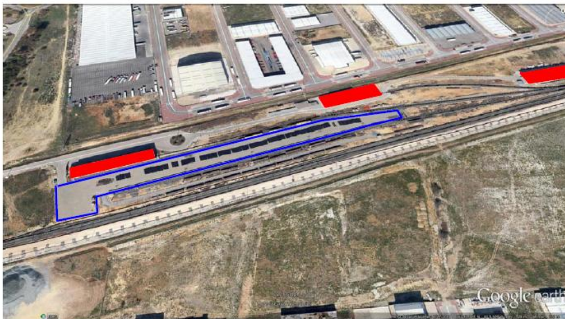
Vista aérea de la Terminal de Transporte de Mercancías, con delimitación, en color azul , del espacio objeto de la licitación. En color rojo , los edificios y espacios excluidos de la licitación.